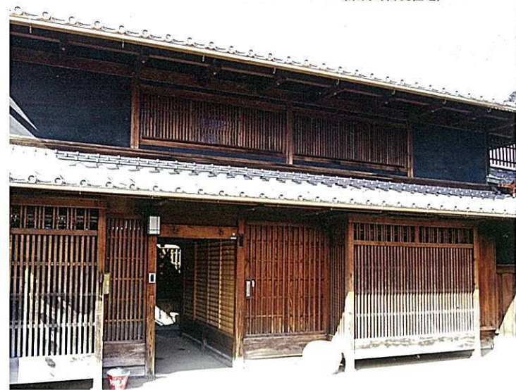
奈良町にぎわいの家 (奈良町传统住宅)