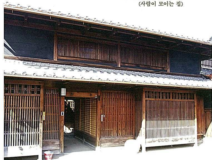
奈良町にぎわいの家 나라마치 니기와의노이에 (사람이 모이는 집)