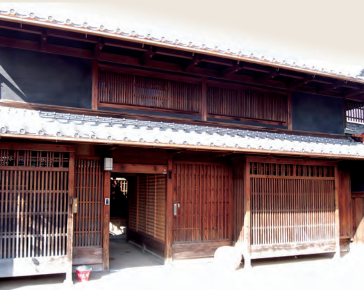
奈良町にぎわいの家