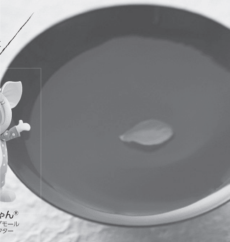
シカの白ちゃん® 三条通ショッピングモール オリジナルキャラクター