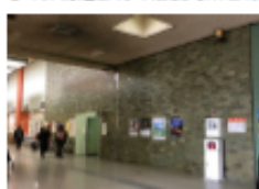
〔市民ロービー内壁タイル〕

非構造部材は、地震などの震動による脱落・落下の恐れがあるため、事故を未然に防ぎ施設利用者の安全を確保する必要性が建築基準法で規定されていることから、内壁タイルや特定天井（市民ロービー（中央棟1階）、議場（西棟3階））等の非構造部材の耐震対策を行う。