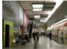
〔市民ロービー天井〕