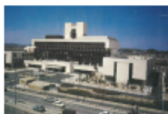
〔昭和52年新築当時の庁舎〕