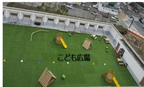
東棟屋上南側（こども広場）