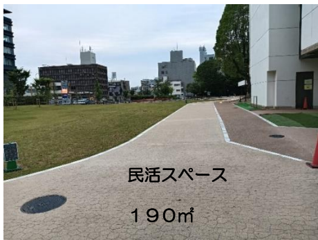
南側広場(民活スペース)