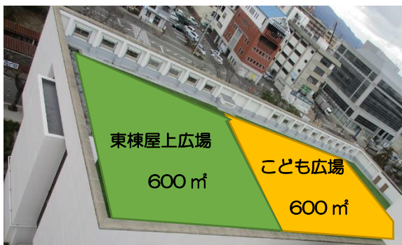
東棟屋上広場（北側）