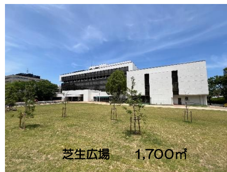
南側広場(芝生広場)

・対象範囲は市役所南側広場で、民活スペース（イベント機材の設置やキッチンカーの車両の設置スペース等）が約190㎡、芝生広場が約1,700㎡となります。