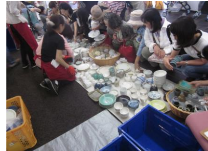
(表2-2-8) もったいない陶器市開催実績

いらなくなった陶磁器製食器は捨てるとう燃やせないごみになってしまいますが、欲しい人に使ってもらうことでごみを減らすことに繋がります。