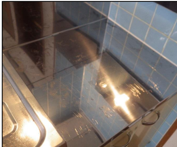
A : コンロ台 錆汚れがあります