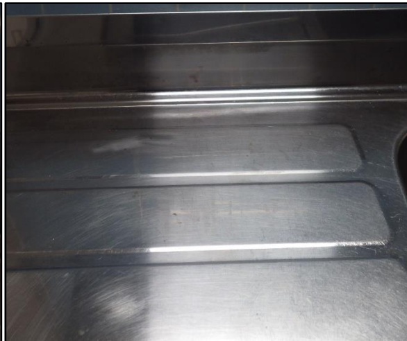
C : シンク水切り場 水垢汚れがあります