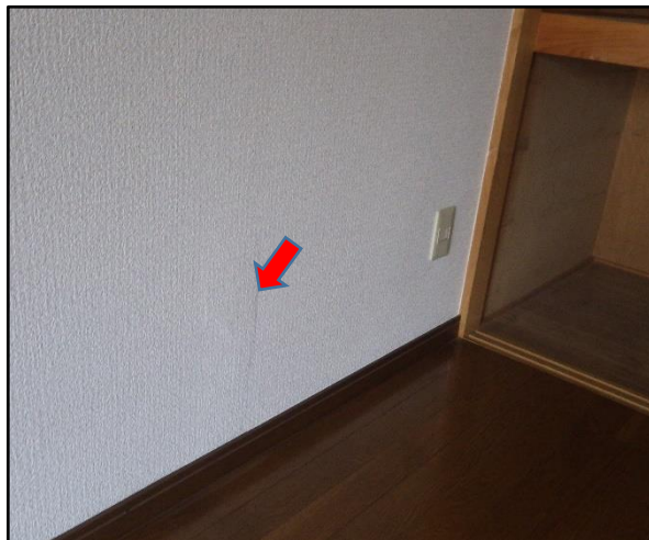
D : 洋室壁紙 壁紙に浮きがあります