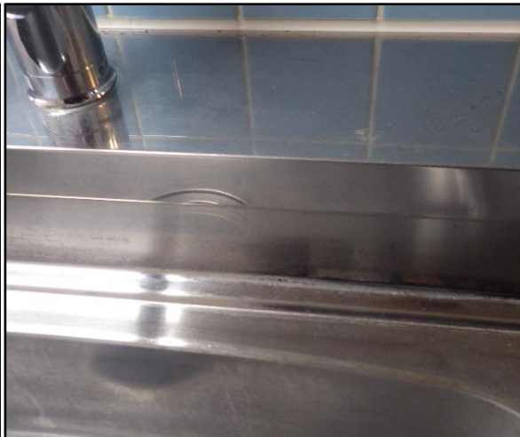
B : 台所水廻り 水垢汚れがあります