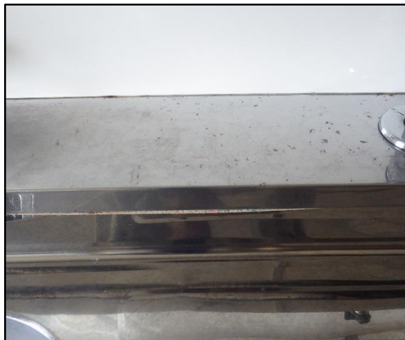
A : 流し台水廻り 水垢汚れがあります。