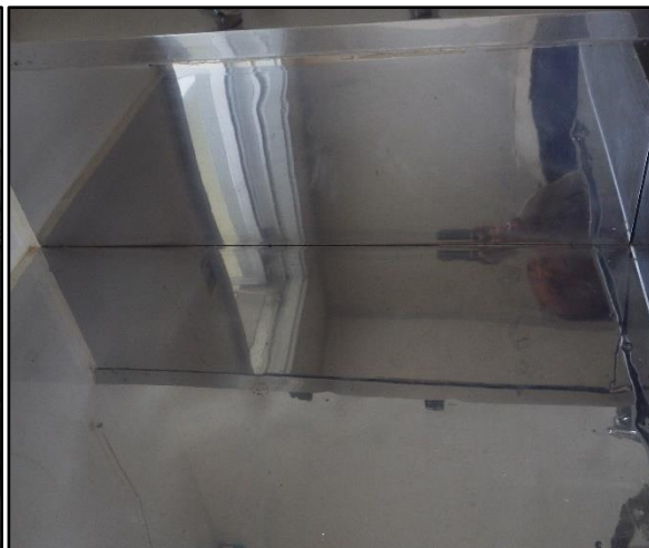
B : コンロ台 汚れがあります。