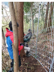
斜面での設置の様子

阪原町(営農組合)では、鳥獣被害防止総合対策交付金を活用した鳥獣の侵入防止柵の設置作業が行われており、その様子を見学させていただきました。