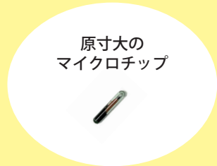
原寸大の マイクロチップ

令和4年6月1日に「改正動物愛護管理法」が施行され、販売される犬や猫へのマイクロチップの装着・登録が義務付けられました。犬や猫を家族に迎え入れた飼い主は自分の住所や氏名、電話番号を変更登録する必要があります。