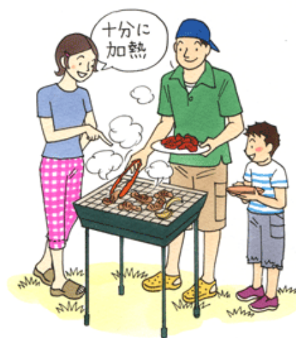
政府広報オンライン HP