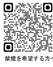
禁煙を希望する方へ