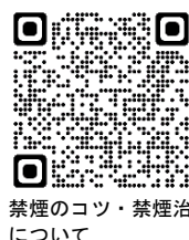
禁煙のコツ・禁煙治療について