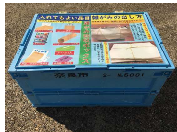
▲雑がみ回収ボックス