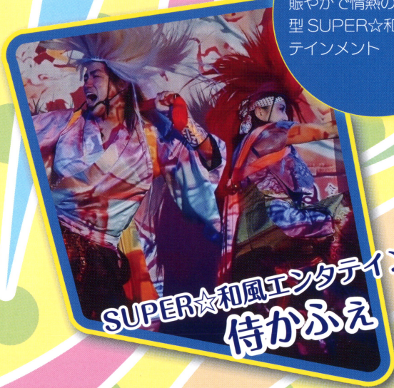
SUPER☆和風エンタテインメント 侍かかえ