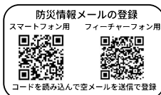
コードを読み込んで空メールを送信で登録