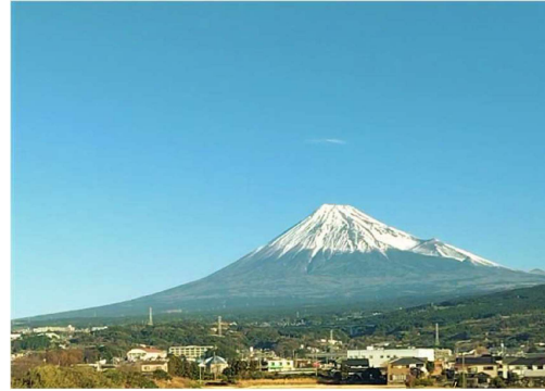
快晴の空と富士山

2024年が始まりました。いよいよ私達には区切りの年になります。感謝の気持ちを込めてまだまだ挑戦させていただきます。