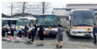
スクールバスで下校する児童

また、気をつけて登下校するよう学校で児童生徒へ指導し、通学路に関してはPTAや地域の方々のご協力を得ながら安全確保に努めていきます。