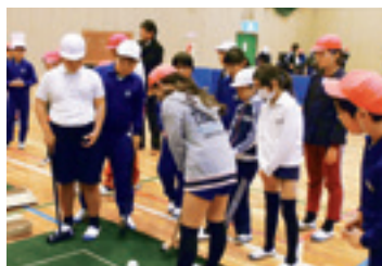
統合再編前の交流学習

児童生徒の不安を最小限にするよう、学校関係者や教育委員会等で協議を行い、統合再編までの間に児童生徒同士の交流を目的とした交流学習等を実施していきます。また、学習面・精神面に配慮した体制づくりに努めていきます。