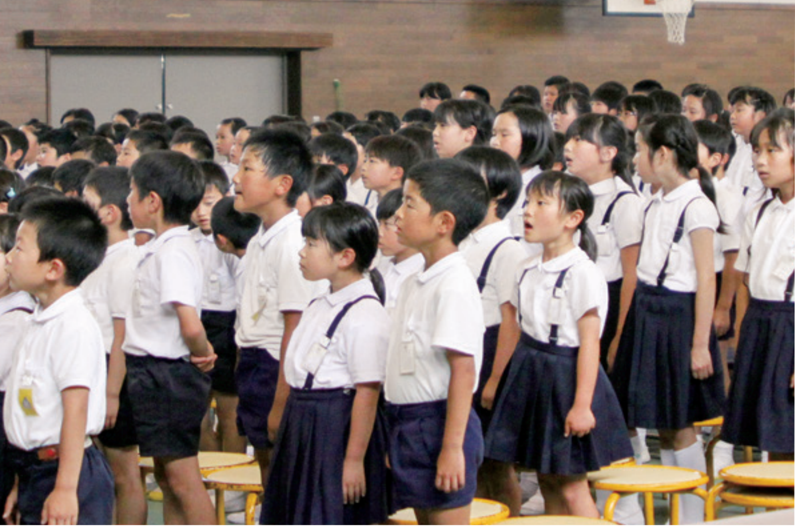
開校記念式典で校歌を歌う児童