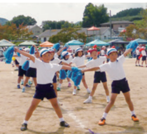
児童による集団演技

子どもの数が増えて見ごたえがあり、どの競技や演技にも一生懸命に取り組んでいました。また、上級生として下級生をしっかり導いている5・6年生の姿にも感動しました。