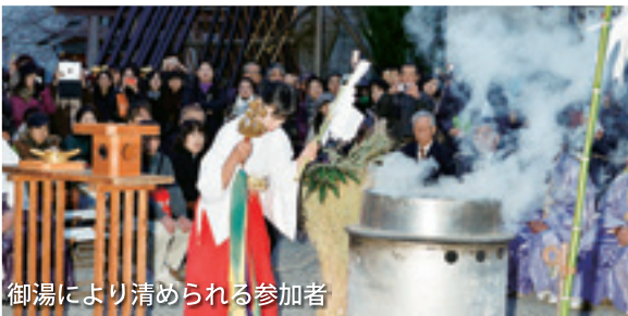
御湯により清められる参加者

そして、祭りの参加者を神聖な湯で清める「御湯（みゆ）」（湯立てとも呼ばれます）の行事が、巫女によって行われます。この日は地元商店街の人達による、祭りの名物料理「のっぺ汁」の振る舞いもあり、多くの人で賑わいます。ぜひ足を運んでみてください。