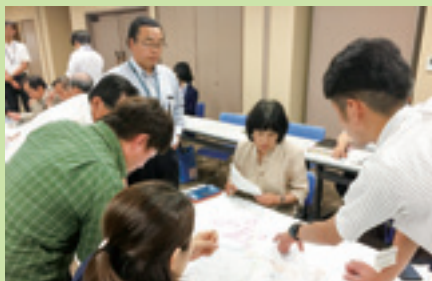
▲開校まで学校規模適正化検討協議会等を定期的に開催し、保護者や地域の方、学校関係者と校舎改修、校名・校歌・校章等について話し合いました。