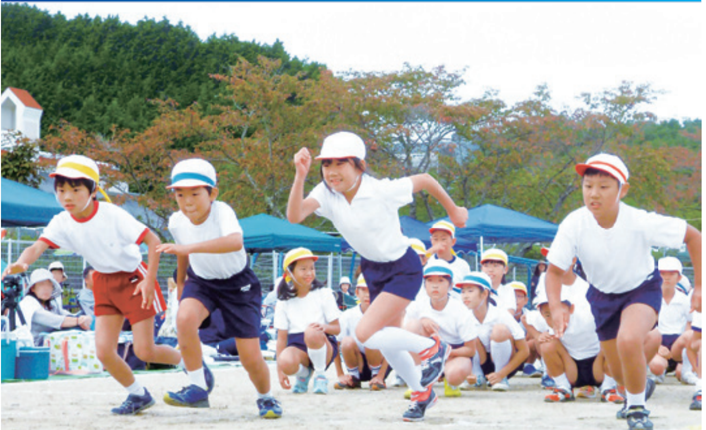
都祁小学校運動会での徒競走

子どもたちには夢があります。未来があります。可能性があります。 私たちの大切な宝である子どもたちが、自らの力で輝き、地域や社会、未来を照らす光となるように、奈良市ではさまざまな教育を行っています。 奈良市教育だより『きらめき☆奈良』では、奈良市の教育を紹介します。