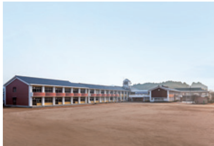
大規模改修後の都祁小校舎

学校規模の適正化は、学校の適正配置と適正規模を維持することにより、教育環境を整える事業です。また、施設一体型の小中一貫教育を行うなど様々な方法でより良い教育環境づくりを行っています。