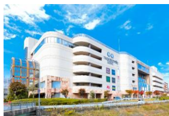
ならファミリー (近鉄百貨店入居)