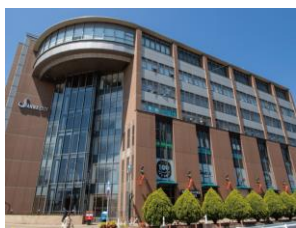
サンワシティ西大寺