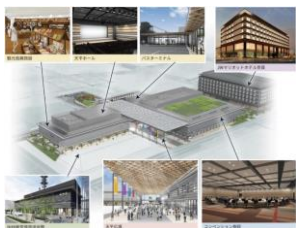
奈良県コンベンションセンター