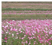
阪原のコスモス畑