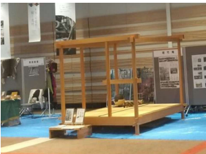
(若竹庵 出店の様子)

9/1(金)と9/2(土)の2日間、奈良県コンベンションセンターで開催された「なら奈良まつり」の、文化体験コーナーに出展させていただきました。 当日は奈良県内の老舗のお店さんと一緒でしたので、少し恐縮しました。 おかげさまで、多くの方と情報交換し、コミュニケーションを取ることができました。