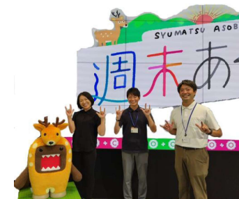
東部出張所源興係のお二人とスタジオで一緒に撮影

9月1日で任用から2年が経ちました。任用記念日に、NHK奈良放送局「ならナビ」の「週末あそび」で観光PRに出演させていただきました。とても緊張してしまいましたが、貴重で幸せな経験をさせていただきました。最後まで心を引き締めて活動をさせていただきます。よろしくお願いいたします。