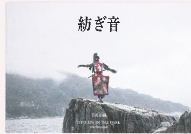
紡ぎ音 岩波友紀 (第四回受賞作品)