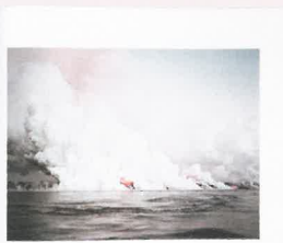
波を綴る 真鍋奈央 (第三回受賞作品)