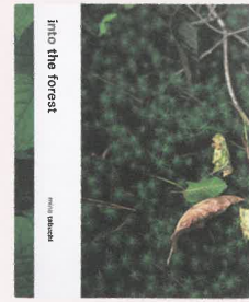
into the forest 田淵三菜 (第二回受賞作品)