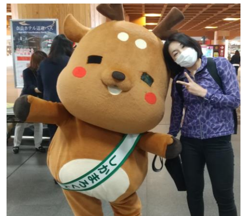
しかまろくに会いに行きました。 ついに奈良で対面。感動!!!