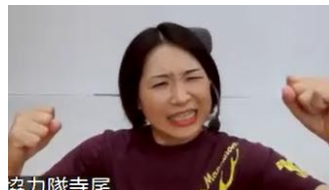
顔芸もあり? 表情を大きく。