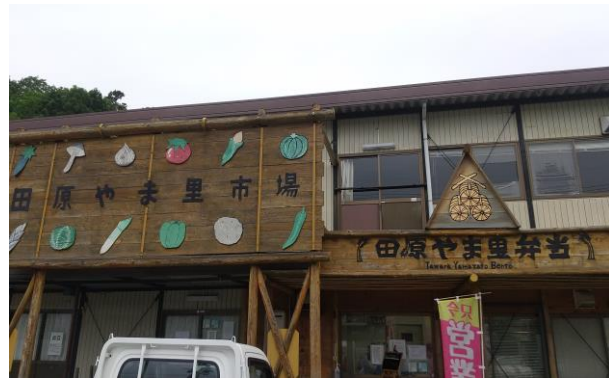
移住希望者さんと食べた田原やま里弁当

空き家バンクに登録出来ない方、もしくはしたくない物件に対して、空き家所有者と移住希望者を紹介する事業を検討しております。こちらの事業においては、様々な方との相談、検討を重ねて進めて参ります。