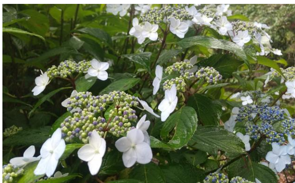
空き家調査をした近くの紫陽花

所有者と空き家コンシェルジュと、地域おこし協力隊が現地立ち合いを実施し、 4～6月で5軒新規登録 となりました。