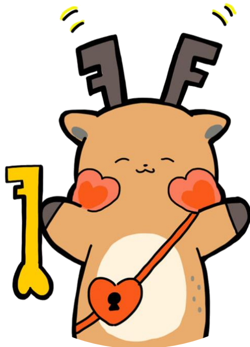
奈良市自殺対策キャラクター 「ラブキー」