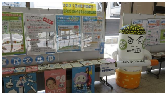
世界禁煙デー・禁煙週間啓発

そのほか、市立看護専門学校を平成25年に開校し、地域保健の担い手としての看護師の養成にも力を入れています。