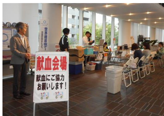
献血及び骨髄バンクドナー登録会