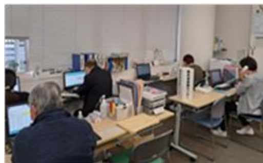
奈良市陽性者登録センター

第6波をふまえ、第7波では保健所機能の正常化を保つため、派遣の専門職・事務職を増員しましたが、第6波を上回る急激な陽性者増加に、今回も部外からの協力を得て、人員体制を強化し対応しました。