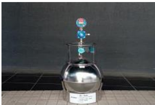
大気の採取の様子

本市では、平成9年度から調査を開始しており、現在、市内3地点で定期的に調査しています。令和3年度においては、環境基準値が設定されているベンゼン、トリクロロエチレン、テトラクロロエチレン、ジクロロメタンについて、いずれも基準値を下回っていました。