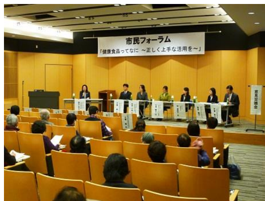
市民フォーラム「健康食品ってなに～正しく上手な活用を～」

医事薬事係では、医療従事者の免許申請受理業務や、人口動態調査や国民健康・栄養調査の実施、医療施設の開設許可や監視業務、特定給食施設指導を担当しています。また、市民の方々からの医療安全相談にも対応しています。