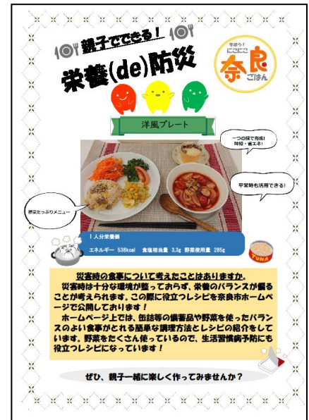
「親子でできる！栄養（食）de防災」パンフレット

健康増進課では、がん・脳卒中・糖尿病などといった、いわゆる生活習慣病の予防のための知識の普及や健康相談、疾患の早期発見・予防のための各種がん、歯周疾患、骨粗しょう症などの検診を行っています。また、子ども及び成人を対象とした定期予防接種を実施しており、令和3年度はHPVワクチンの接種勧奨を再開しました。新型コロナウイルス感染症の感染拡大防止を考慮し、「歩数計アプリで20日ならウォーク」や「親子でできる！栄養（食）de防災」パンフレット作成、フォトコンテスト等に取り組みました。