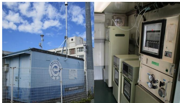
大気の常時監視業務を行っている大気局 (左：大気局外観 右：測定機器)

また、騒音・悪臭などの公害の防止に関連する法律に基づき、公害に関する苦情の対応や、発生源となりうる工場・事業場への立ち入り検査を実施し、必要に応じて指導等を行っています。