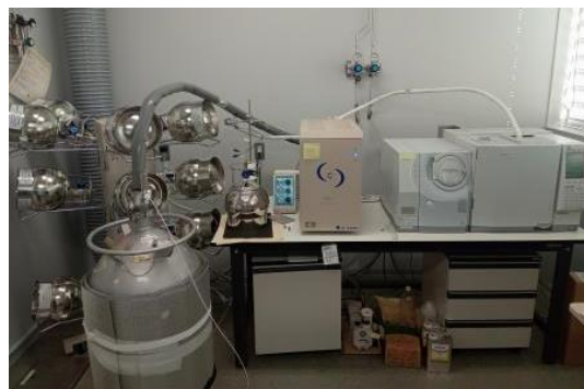
機器による分析の様子