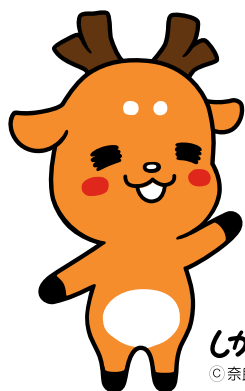
しかまろくん