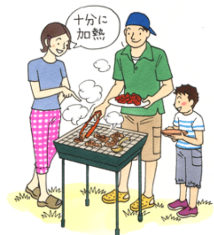
政府広報オンライン HP