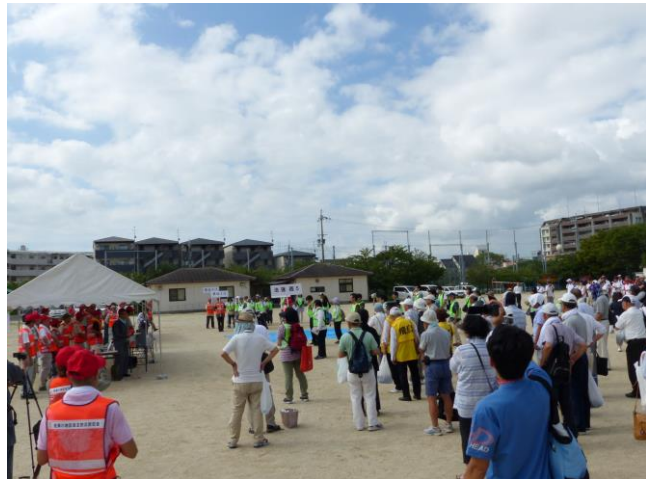
【前回（令和元年度）開催時の様子】

近年、多発している大規模な自然災害、特に突然発生する地震に対して、「自助」、「共助」、「公助」の連携を実践する機会として、市内全域の防災スピーカー及び緊急速報（エリア）メール等を活用した情報発信と避難の呼びかけ、市職員の安否確認及び避難所の開設など、実際の地震発生に沿った実践的な訓練を実施します。また、重点会場（佐保川小学校・大安寺西小学校・西大寺北小学校）では、防災関係機関による災害対応時のデモンストレーションや展示、体験等を実施する予定です。