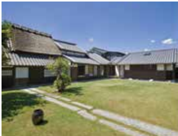
京終・紀寺/京終やまぼうし