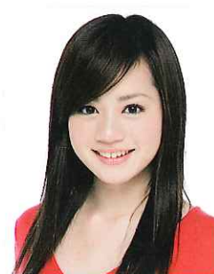
斉藤 雪乃 (タレント)