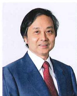
市川 宏雄 (明治大学専門職大学院長)