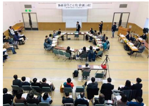
参考：自分ごと化会議 in 松江