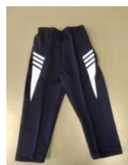
長ズボン（紺色ライン入り）