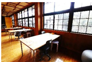
月ヶ瀬ワーケーションルーム「ONONO」