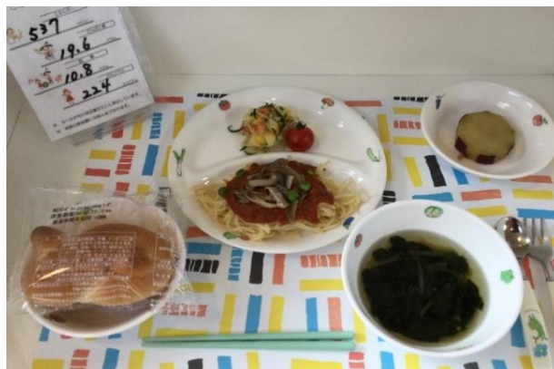
↑ 法人が運営する別の園の給食メニューの例