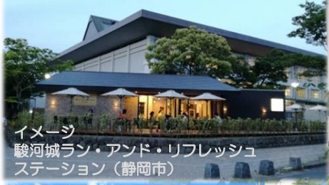
イメージ 駿河城ラン・アンド・リフレッシュステーション（静岡市）