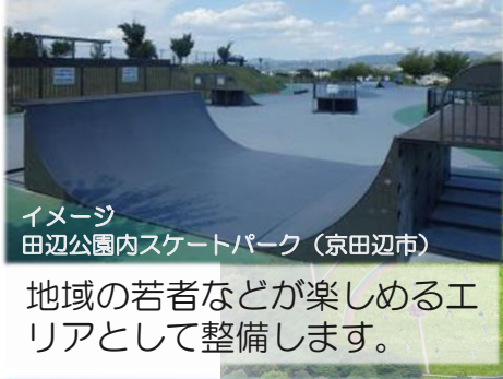
イメージ 田辺公園内スケートパーク（京田辺市）