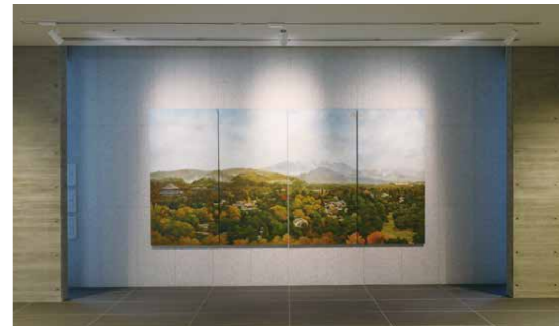
奈良風景「古都遠望」2007 年 油彩 大石良太氏寄贈

「周辺環境と一体化した『森の中の美術館』。人生終焉の場として、ご遺族が心穏やかにお送りできる癒しの場」という市のコンセプトとも合致しており、この名称に決定しました。