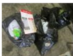
中身の見えない不透明袋 (黒・緑・青色等)