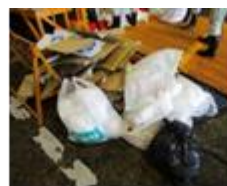
再生資源物 (段ボール等)