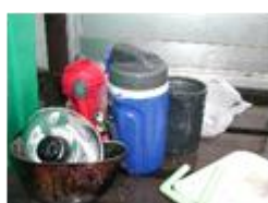
不燃物混載 (可燃ピット搬入時)