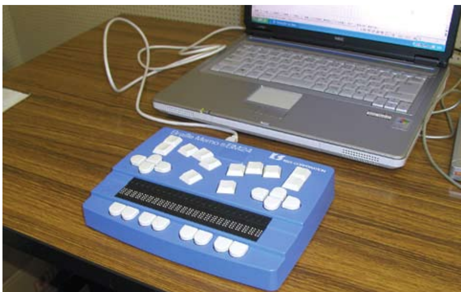
点字ディスプレイ (総合福祉センター)

これらは障がい者が市政へ参画し協働していくための情報を得る有効な手段であり、この給付制度の充実を図るこ