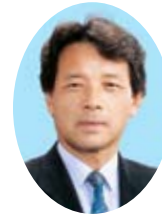
山本 清 議長 (政翔会)