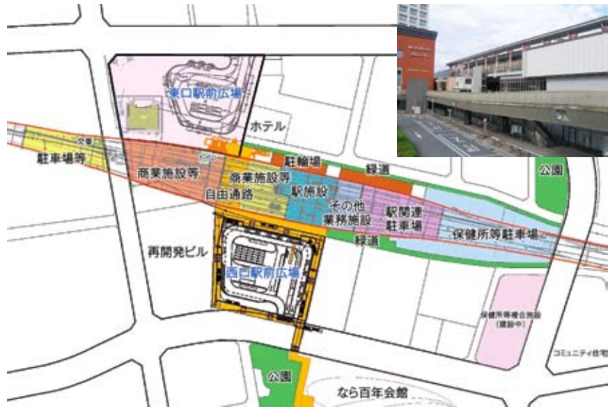
有効利用が望まれるJR奈良駅高架下(イメージ案と現況)

問 JR奈良駅周辺の連続立体交差事業により生み出される高架下の活用は。 答 連続立体交差事業は、平成22年春の完成を目指し、県市、JR西日本の3者で鋭意進めている。 高架下の1階部分は、旧三条踏切跡(通称三条通り)から北側は交番の移転先として活用し、三条通りから東西駅