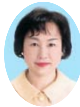
高杉 美根子 (公明党市議会議員団幹事長)