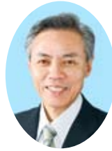
委員長 西本 守直 市議会情報公開審査会委員 (日本共産党市議会議員団)