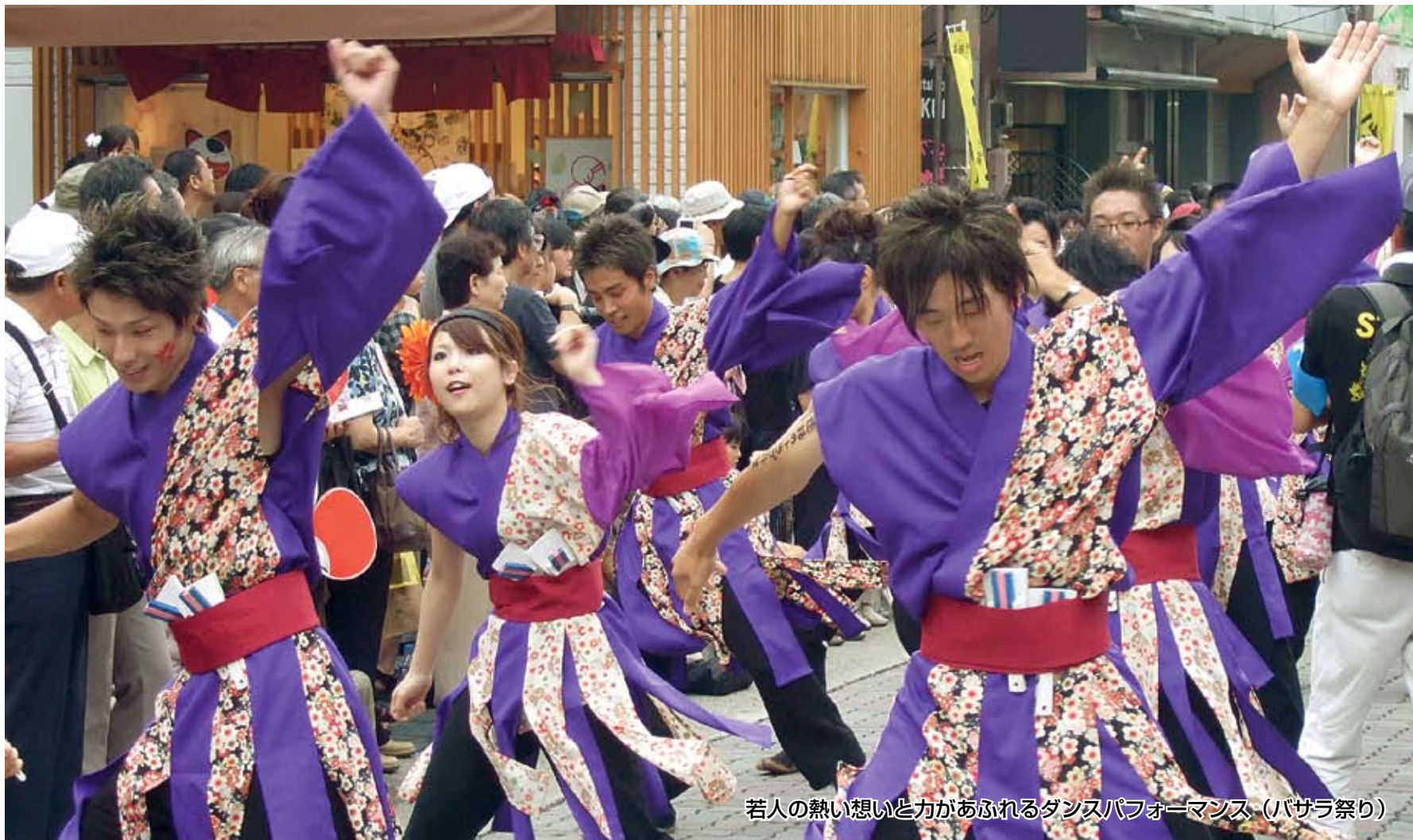
若人の熱い想いと力があふれるダンスパフォーマンス（バサラ祭り）