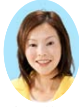
吉川 等子 (日本共産党市議会議員団)