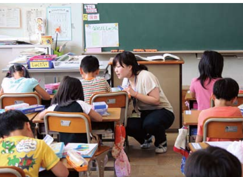
コミュニケーションの図れた授業風景(30人学級)

あるいはそれ以上の期間がかかるものと思われる。また、整備の順序については、順次整備しながら開園していく予定であり、2010年に正殿復原工事が完成する第一次大極殿院地区から優先的に整備されると聞いている。