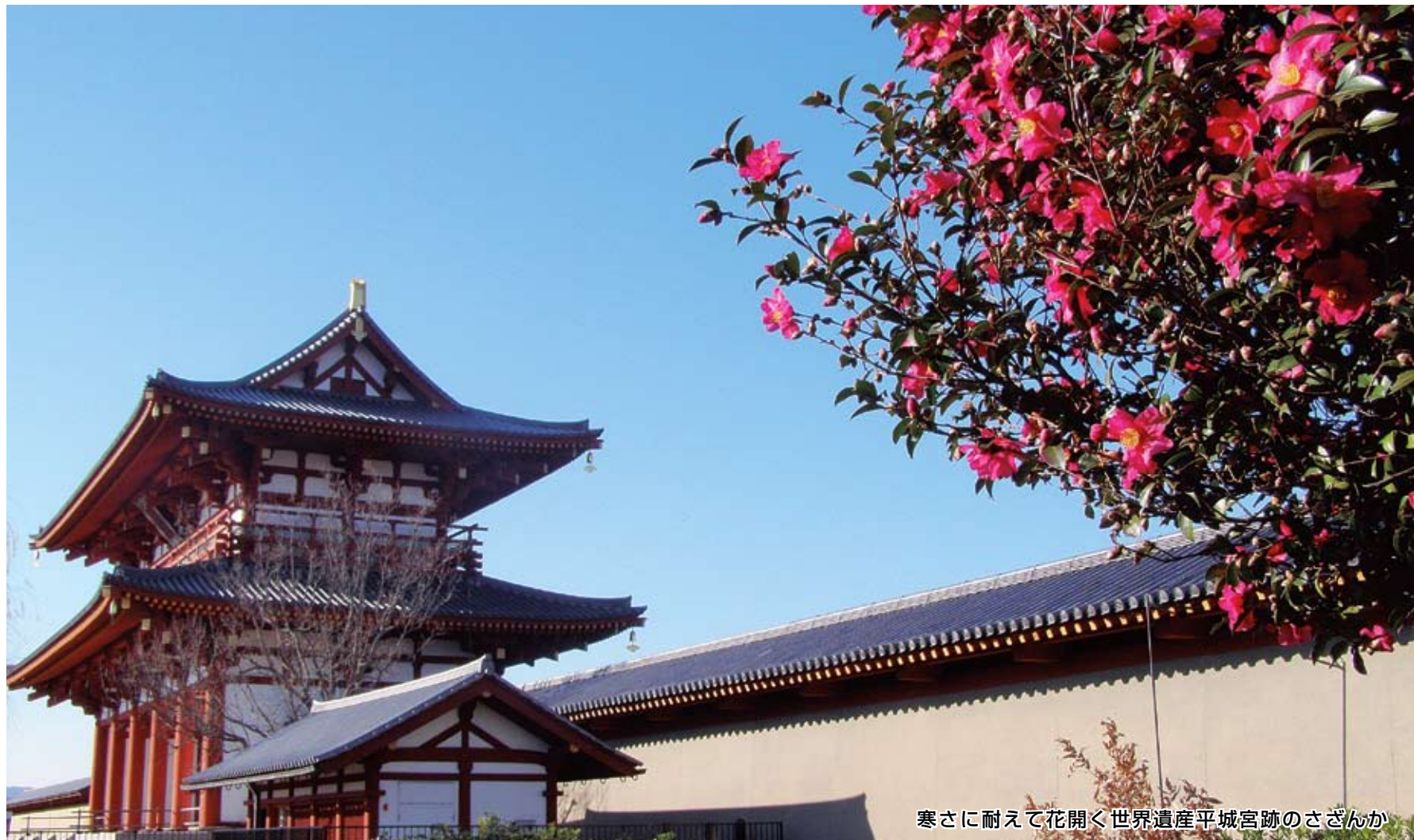
寒さに耐えて花開く世界遺産平城宮跡のさざんか