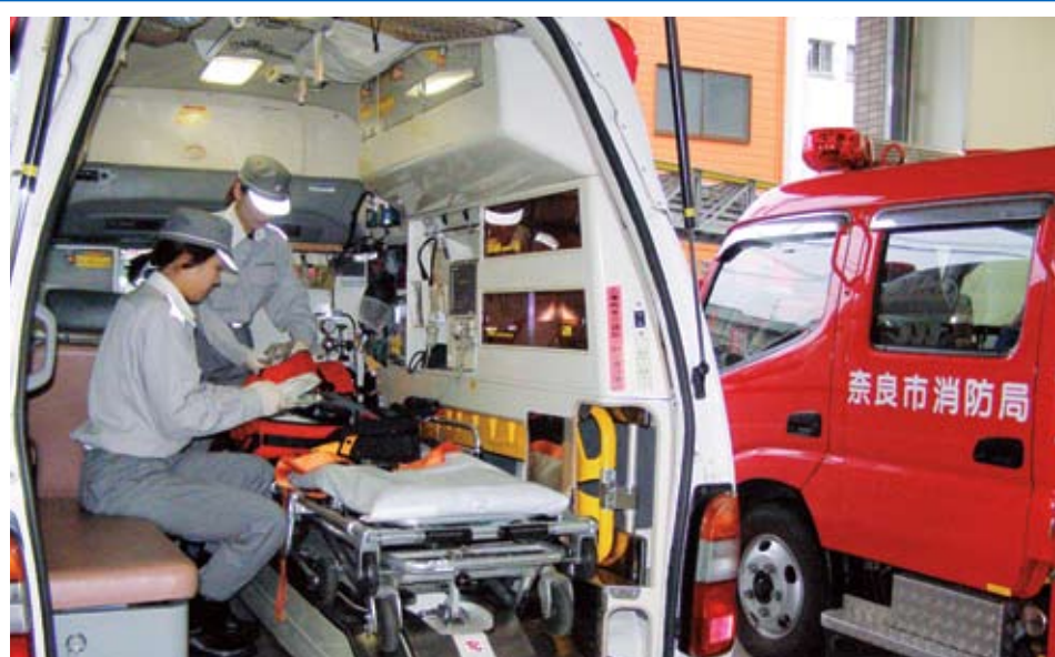
出動に備え、準備に余念のない女性救急隊員(中央消防署)

充実には欠かせぬ課題である。 また、男性・女性救急隊員を問わず、大変厳しい過酷とも言うべき勤務体系である。 救急隊は仕事柄ストレスのたまる職種でもあり、現在の2交代制を3交代制にするなど勤務体制を見直す必要は。 答 救急隊の労務管理の重要性を認識し、組織体制の強化や勤務形態の工夫等、検討してきた。 その一つとして平成22年度に西消防署富雄出張所を分署に格上げし、高規格救急車の運用を予定している。 今後も救急件数が多い消防署所では、実情を踏まえ最適な方法で労務管理が図れるよう検討していきたい。