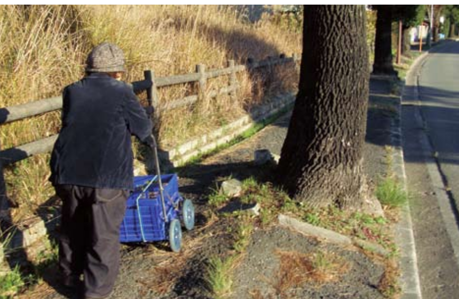
「あ！通りにくい」歩道を狭める街路樹(奈良阪町)

なぜ、協定や契約に違反してまで株式会社ゼファアを優遇したのか。また、ゼファアを選定されたもので、問題はなかったと考えている。