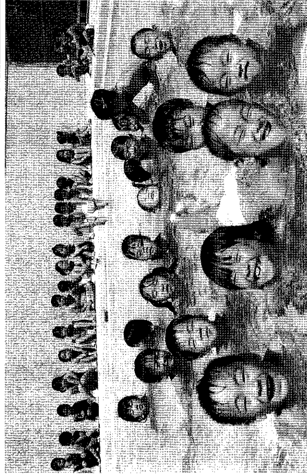
暑中、プールで気持ちよく泳ぐ園児たち (六条幼稚園で)

初日に市長は招集あいさつの中で、本年は中国西安市と友好都市提携を表現して二十年になる。去る五月十八日、十九日の両日、奈良県新公学において、日中間で友好都市提携をしている百五十二の