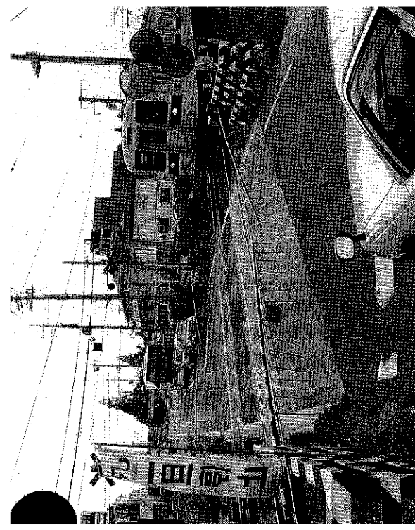
J R R 線 西 関 線 踏 切 通 り 一 条 街

問 JR線と近鉄線立体事業は、一条通りの混雑解消や、京終駅周辺の活性化のため、工事区間を延長すべきではないか。 また、この事業とJR奈良駅、リニアの新駅、近鉄奈良駅等との一体性をどのように作り出していくのか。 答 現在計画している工事区間は、関西線は佐保川堤防付近から大安寺踏切付近まで、桜井線は春日中学校付近までであり、この区間が国の事業採択条件を満たしている。一条通りを越えての延伸は、国の補助は受けられず、財政上の問題等あり困難である。京終駅までの延伸は、道路整備計画や駅周辺の面的整備の具現化に時間を要するので将来の研究課題とした。 JR及び近鉄の奈良駅やリニアの駅の一体的な整備につ