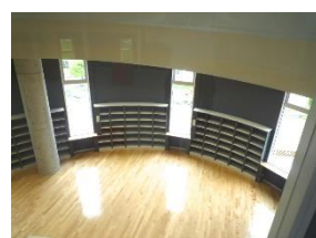
図書メディアセンター