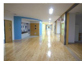
教室と繋がる廊下