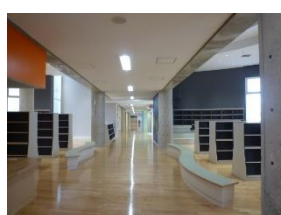
図書メディアセンター