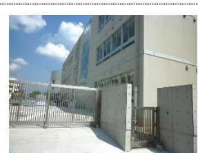
西門より望む校舎

本来なら、新校舎の完成に伴い見学会を開催すべきところですが、新型コロナウイルス感染症予防のため実施することができていないことをご了承ください。