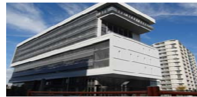
奈良市保健所・教育総合センター (愛称：はぐくみセンター)

平成23年4月にオープンした奈良市教育センターは、本市の教育の中核的な施設として、様々な教育課題の解決と、子どもたちの豊かな学びを保障するとともに、子どもたちが集い学び、保護者や地域の方々とともに学ぶことのできる施設です。