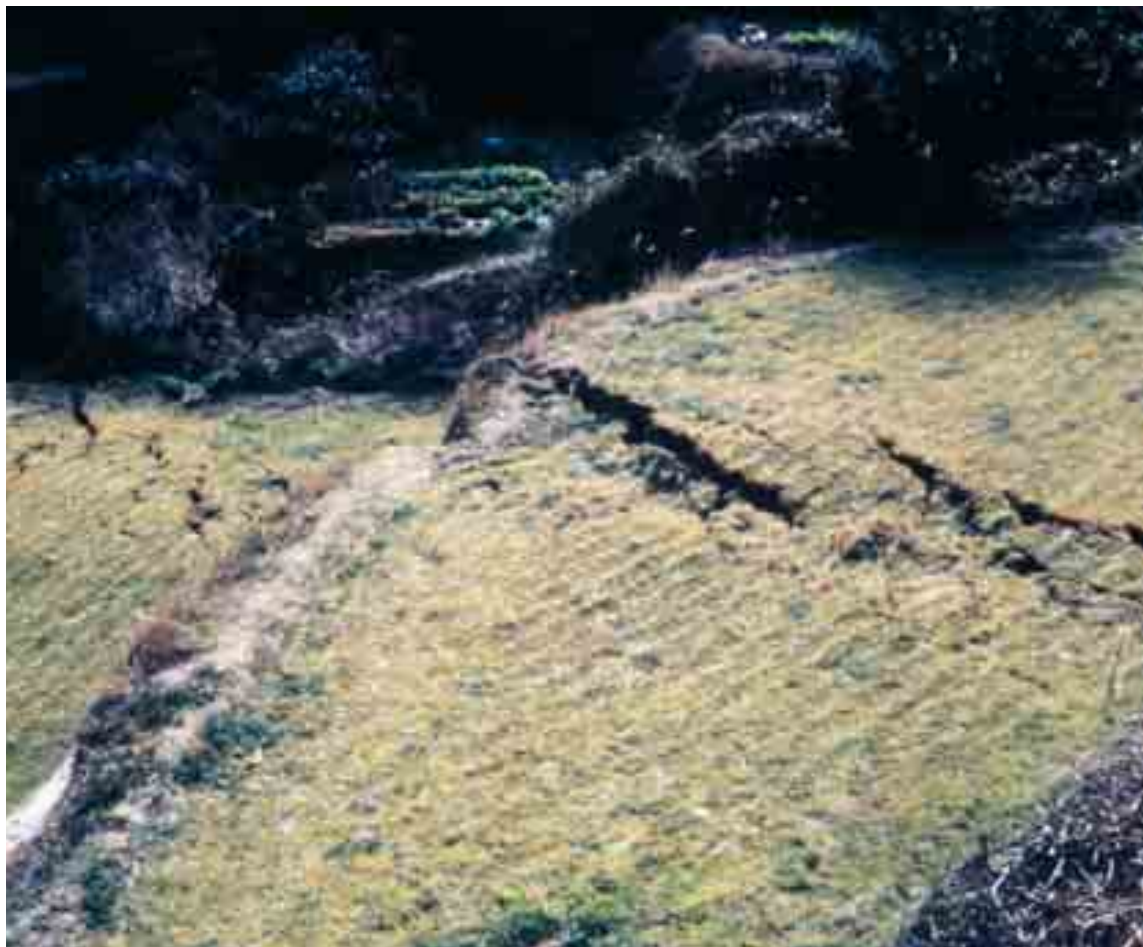
(写真は、阪神淡路大震災でできた野島断層の地割れ)