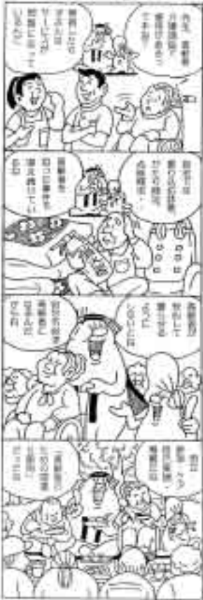
奈良市人権教育・啓発推進本部