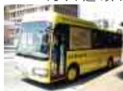
環境にやさしいCNG（圧縮天然ガス）バス

銀バスはほぼ北和・中和のバス路線をおさえたわけだが、戦争がはげしくなると、ガソリンや資材が配給となり、三九年（昭和一四）以後、休止路線がふえ、市内の運転回数も減る。国家総動員法が出て陸運にも統制が加わり、政府は事業の統合をすすめた。四三年（昭和一八）七月、銀バスは吉野宇陀交通など四社とともに、奈良交通株式会社にとまり、以後、奈良交通が県内のバス路線をほとんど独占する。