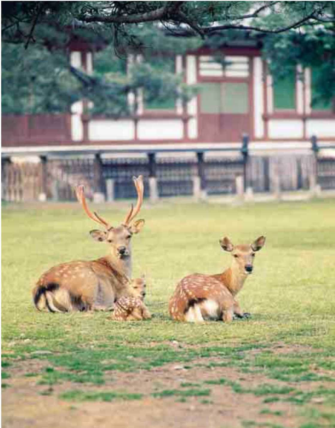
入江泰吉「親子鹿」 (1975年撮影)