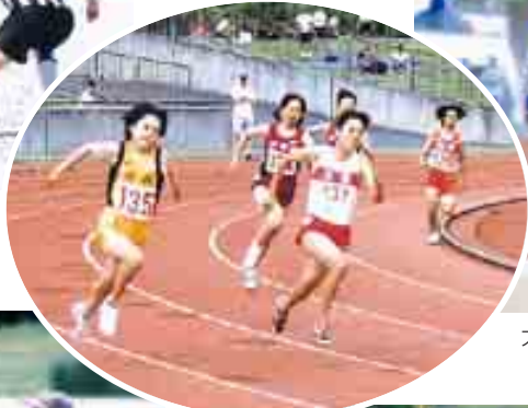
手に汗握る接戦を繰り広げる陸上競技