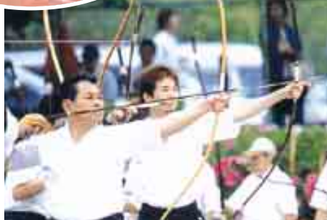
精神統一して的を射る