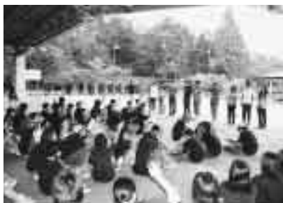
昨年の尾道市での交流事業から

平成10年に市制100周年を迎えた4市の小学6年生が毎年順番に各市を訪問し、交流を深めます。今年は青森市を訪問します。他市のみなさんと一緒にいろいろな体験をしながら3日間を過ごし、小学生最後の夏休みに楽しい思い出と遠くの街の友達をたくさん作りましょう。