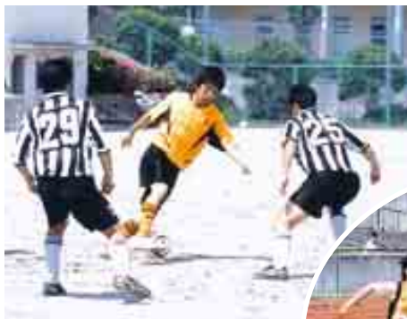
目指せ！ハットトリック