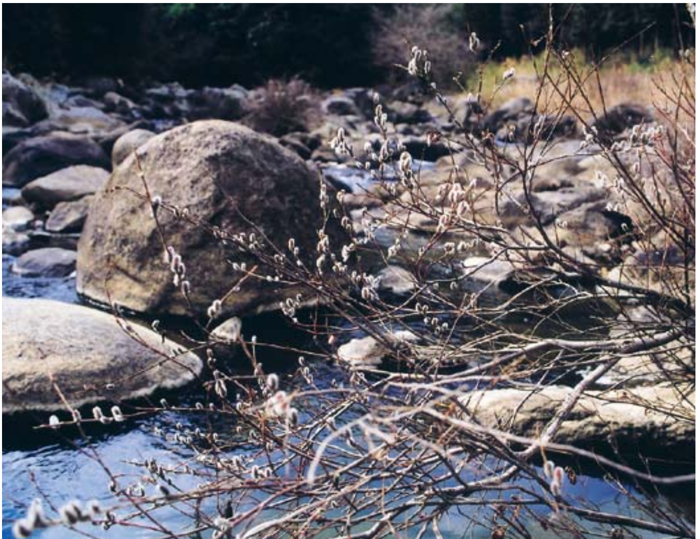
柳生のねこやなぎ