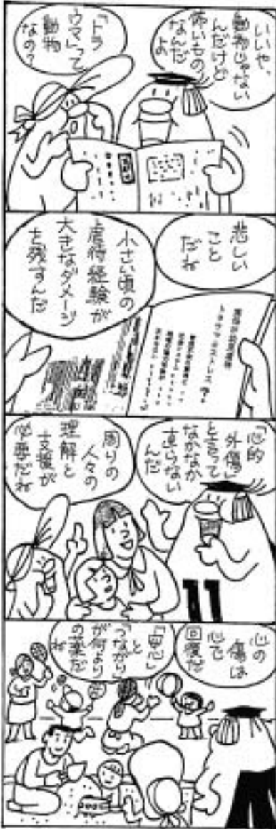
奈良市人権教育・啓発推進本部