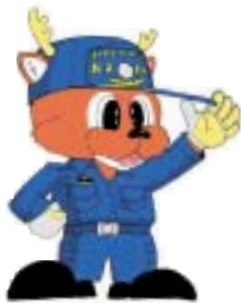
消防局マスコットキャラクター「なっぴい」

火災は、ひとたび起こってしまえば、尊い命や財産を一瞬にして奪ってしまう恐ろしいものです。「これくらい大丈夫...」といった油断や、ちょっとした不注意から火災を発生させないように、一人ひとりが火災予防に心がけましょう。