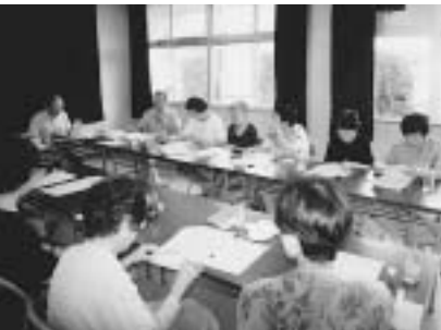
地域で行う学習会

誰もがいきいきと生活し、快適な長寿をおくることのできることを願って、この協会は平成十二年十月に設立されました。快適な長寿とは心身共に健康で、生きがいのある日々をおくっている九十歳以上だと思っています。はじめは十二名だった会員も今では四十七名の支援と協力の下、高齢者を対象に文化教育事業と介護福祉事業を柱に積極的に取り組んでいます。 文化教育事業では、地域の方々の協力を得て、健康で活力ある生活をしてもらうための講演会、保育園児や幼稚園児とともに行うハーブによる園芸療法などを企画しています。また、介護福祉事業では、訪問介護やヘルパー研修などを行い、地域の実情にあつた有意義な活動にしたいと考えています。そして地域の活性化に貢献できたらと思っています。 例えば、協会の一グループ