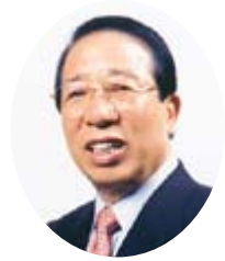
奈良市長 大川靖則