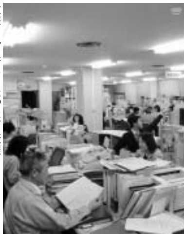
改装され、新しくなった市保健所

日本人はお風呂好き、家にお風呂があってもたまには大きな浴槽でのんびりとお風呂に入りたいものです。最近では、市内にも駐車場付の大型公衆浴場がありますが、公衆浴場の営業許可と衛生管理の指導を生活衛生課が担当しています。家庭用の二十四時間