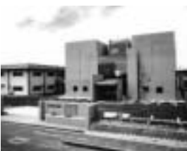
埋蔵文化財調査センター

現在、同センターで開催中の平城京展「平城京に眠る弥生文化」の展示や調査を担当した職員が、「奈良市の弥生遺跡」・水間遺跡の調査」と題して概要を発表