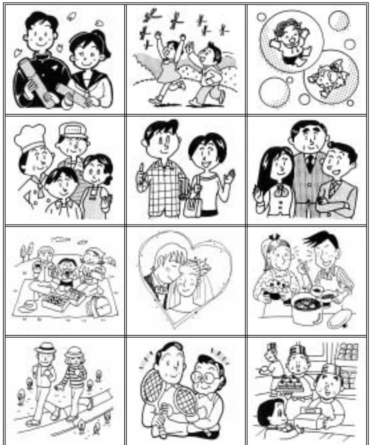
70歳以上の自己負担限度額