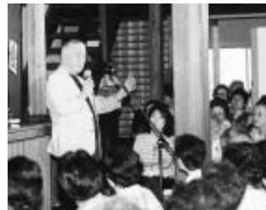
奈良について語る 永六輔さん (会場は名勝大乘 院庭園文化館)

今年4月の中核市移行を記念して、古都奈良の良さを生かした人間性豊かなまちづくりを進めるため、過去に幾度も奈良で講演を行われ、非常に馴染みの深い永六輔さんを迎えて開きます。