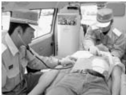
年々増加する救急件数に対応し、救命率向上のため訓練を行っています

救急車は、交通事故やケガ、急病などからみなさんの大切な生命を守るため、いつでも出場できる体制をとっています。