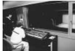
西部地域の文化発信拠点、学園前ホール

シック音楽家をめざす若い人のためのデビューリサイタルが開かれます（出演者募集などの詳細は市役所文化振興課）。「学園前ホールから世界の檜舞台へ」奈良出身の人の巣立ちの場としてのお手伝いや、地域に密着した市民フォーラムをはじめ、未来に広く、深く、グローバルに視野を持って運営していきたいと語ってくださいました。