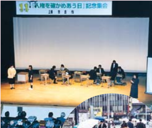
人権を確かめあう日記念集会

また、同和对策事業特別措置法制定が、昭和四十四年（一九六九年）七月に施行されたことを記念して設定された「差別をなくす強調月間」には、県や各種関係団体等と連携し、「人権ふれあいのつどい」をはじめ様々な取り組みで市民運動を盛り上げます。