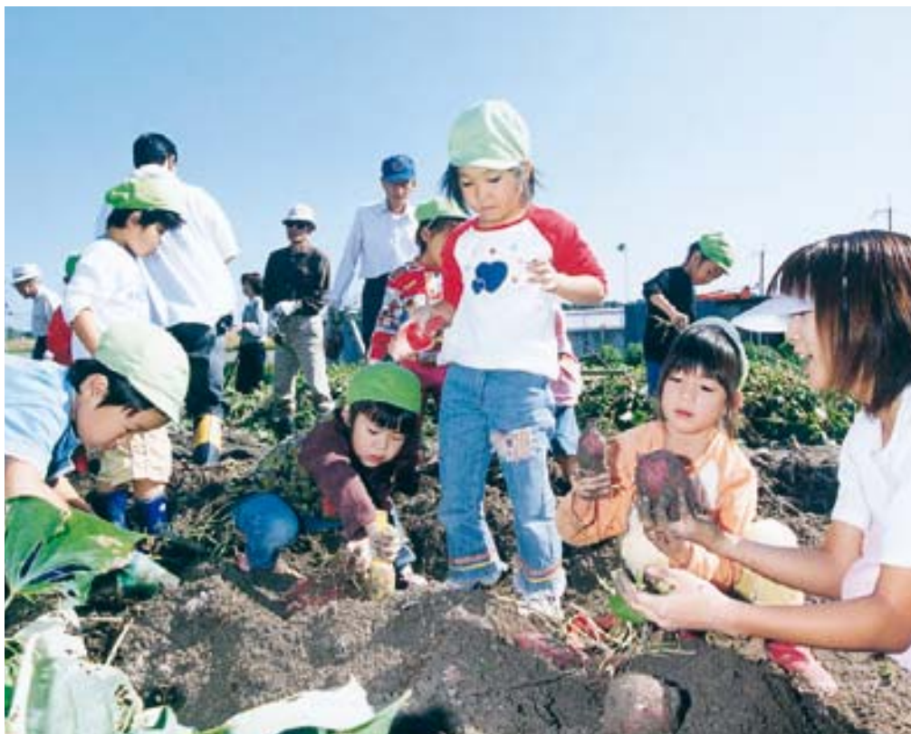
二十一世紀を担う子どもたちに明るい社会を