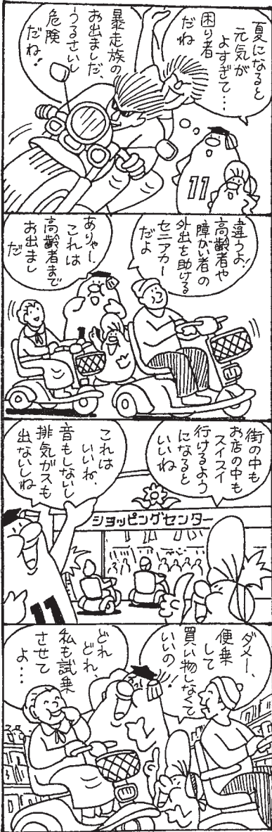
奈良市人権教育・啓発推進本部