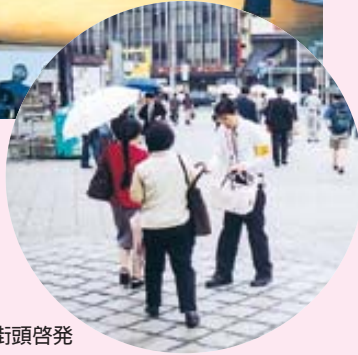
人権擁護街頭啓発