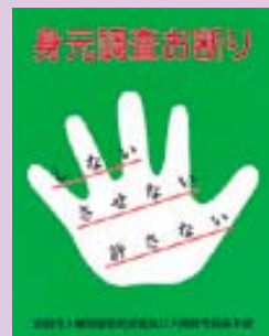
身元調査お断り運動ステッカー

身元調査は、本人の意志や能力に関係のないこと、本人の努力ではどうすることもできないこと（出身地、家庭状況など）を調べて評価したり、排除しようとするものです。それにより、就職や結婚ができないとしたら、身元調査は、差別を許し増長させる許されない行為です。そこで、市民一人ひとりにこの運動を実践してもらうため、「身元調査お断り運動ステッカー」の配布や啓発冊子、広報誌等での啓発活動など、あらゆる機会を通じて運動を進めます。