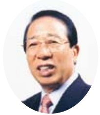
奈良市長 大川靖則