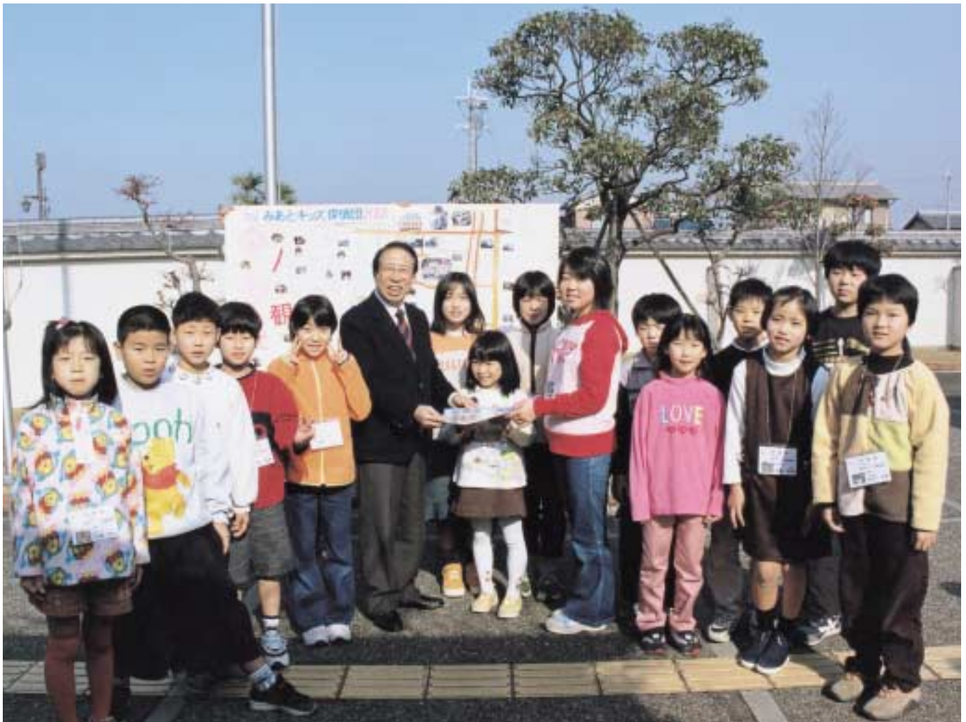
大川市長に観光アンケートの報告をする「みあとキッズ探偵団」