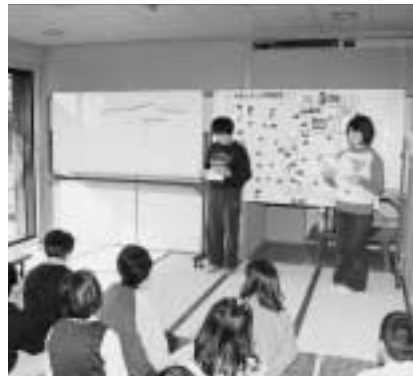
調査結果を報告する探偵団のメンバー

アンケートの内容は、交通手段や世界遺産の認知度、奈良の印象など9項目で、昨年9月に薬師寺と唐招提寺を訪れた観光客103人に聞き取り調査しました。報告書には、その結果を地図やグラフにまとめるとともに、アンケートを実施した各自の感想を記入しています。報告書を受け取った大川市長は、