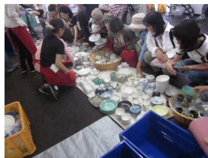
(表2-2-8) もったいない陶器市開催実績

いらなくなった陶磁器製食器は捨てるとう燃やせないごみになってしまうのですが、欲しい人に使ってもらうことでごみを減らすことに繋がります。