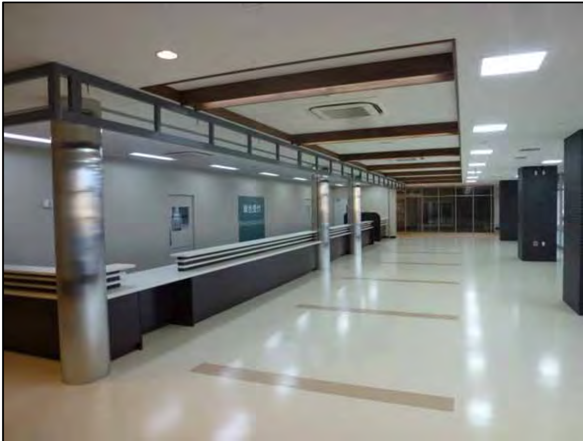
別館1階 総合受付・待合ホール